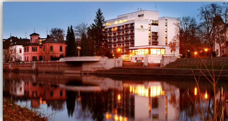
Außenansicht Caravelle Hotel im Park